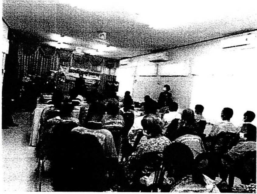
รับฟังความรู้ในการดูแลสุขภาพผู้สูงอายุ