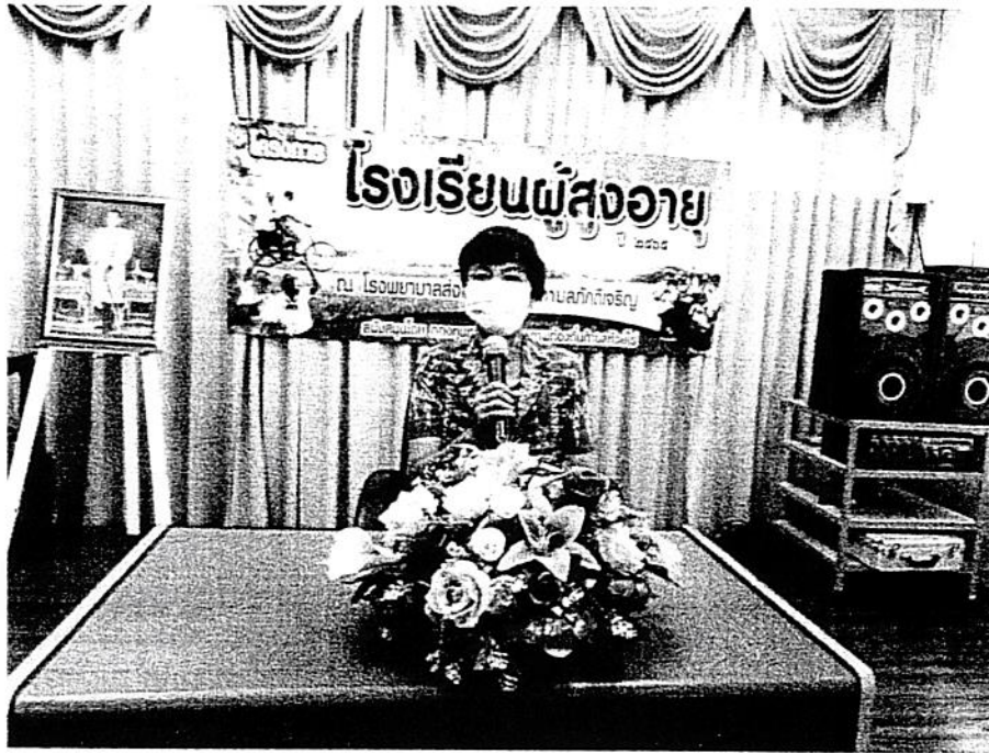
ผอ.รพ.สต.ลือเจริญ เปิดโครงการอบรมโรงเรียนผู้สูงอายุ