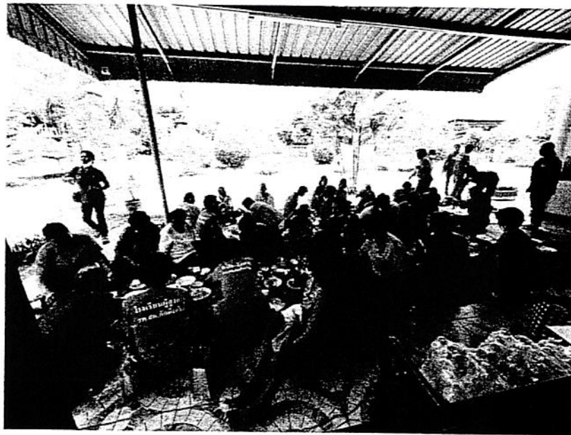
รับประทานอาหารร่วมกัน