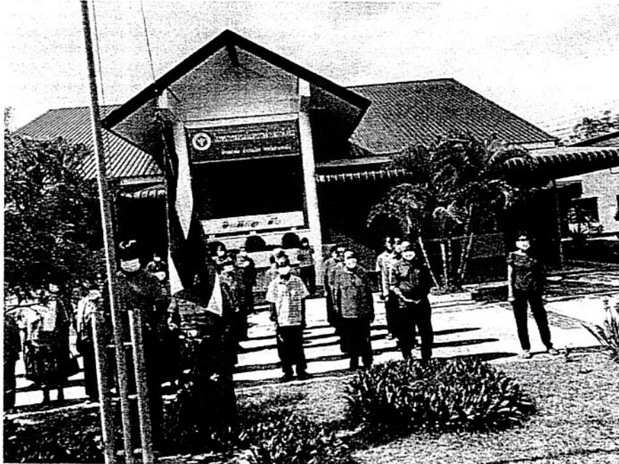
เปิดกิจกรรมโรงเรียนผู้สูงอายุ ปี ๒๕๖๕